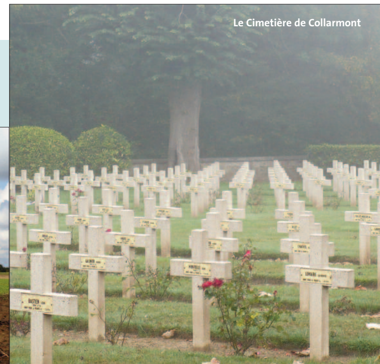
Le Cimetière de Collarmont

La visite d'Anderlues resterait incomplète sans un passage au Cimetière de Collarmont (Chemin de Warmimez). C'est là que reposent les valeureux soldats français qui ont tenu tête héroïquement à l'armée allemande lors de l'invasion du 22 août 1914