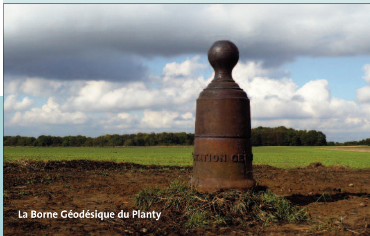
La Borne Géodésique du Planty

Ce contact privilégié avec la nature, les campagnes d'Anderlues peuvent aussi l'offrir ! On peut profiter à loisir de vastes étendues verdoyantes en découvrant le point culminant de la commune et de la moyenne Belgique (212,24 mètres) signalé par la Borne Géodésique du Planty (Chemin du Planty), à la limite de