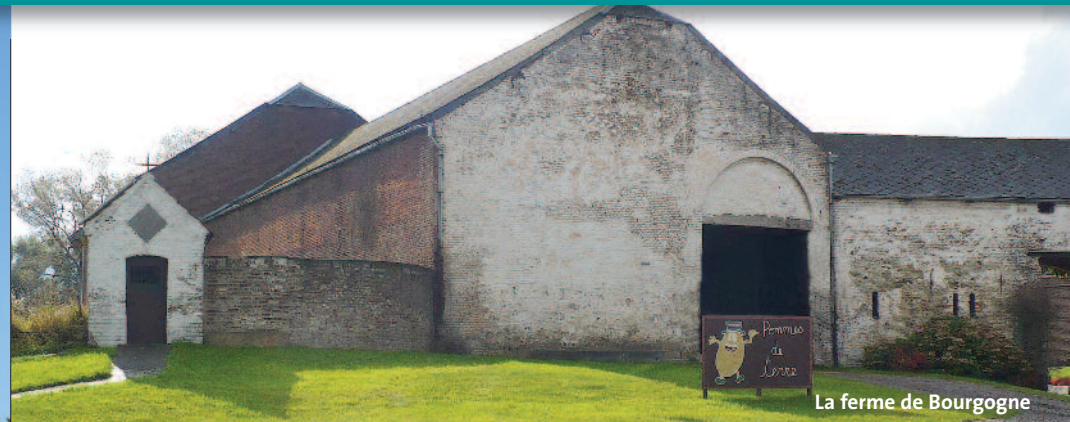
La ferme de Bourgogne

Comme la "Bourlette", le " châssis à molette " domine lui aussi, le paysage anderlusien. Il reste