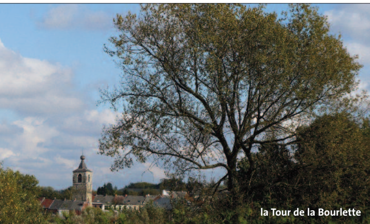
la Tour de la Bourlette

Si Anderlues a gardé de nombreuses traces de son passé ouvrier, elle n'en est pas moins une commune champêtre que nous vous invitons à redécouvrir et apprécier !