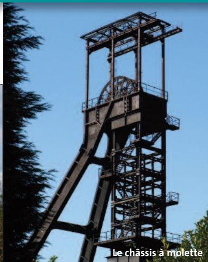
Le châssis à molette

la dernière sentinelle du passé industriel et minier de la région. Le sous-sol est d'ailleurs truffé de galeries qui le découpent comme un morceau de gruyère. Les puits sont fermés mais beaucoup de nostalgiques gardent bien ancrés dans leur cœur le souvenir de cette période de riche activité ! Les terrils se sont couverts d'une végétation foisonnante et ont trouvé une autre vocation : réjouir les amateurs de nature et de vie sauvage, toujours friands de découvrir de nouveaux lieux empreints de calme et de ... poésie